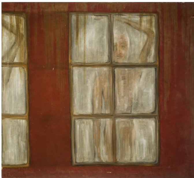
Laurence Wyllie, Sans titre , huile sur toile, 90x101cm.

Une formation de peintre décorateur à Bruxelles, l'orientera vers la fresque murale ou toile peinte jusqu'à ce qu'elle se consacre presque exclusivement à la peinture à l'huile sur toile.