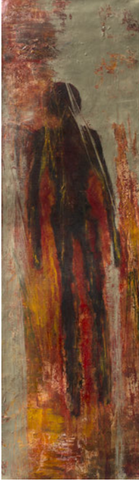
Laurence Wyllie, Sans titre , 2007, huile sur toile, 27x86cm.