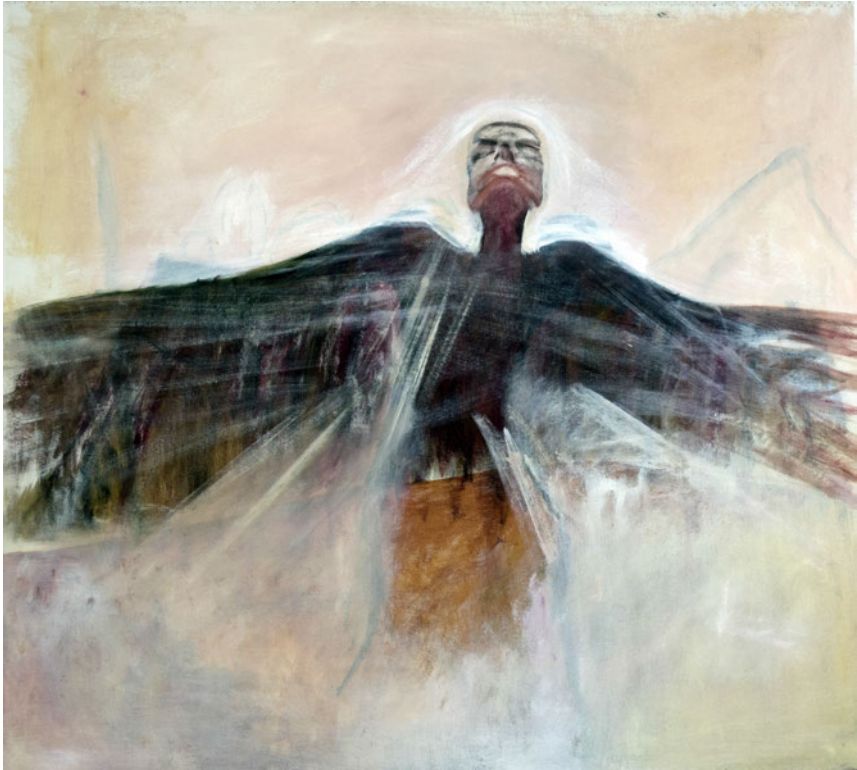
Laurence Wyllie, Sans titre , huile sur toile, 114x127cm.