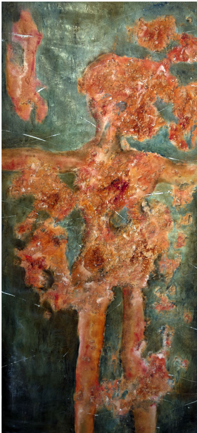
Laurence Wyllie, Sans titre , huile sur toile, 70x145cm.