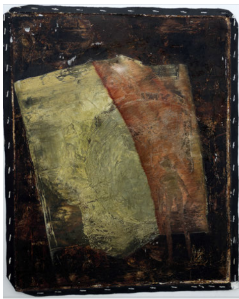
Laurence Wyllie, Cercle 4 , 2003, huile sur toile, 40x50cm.