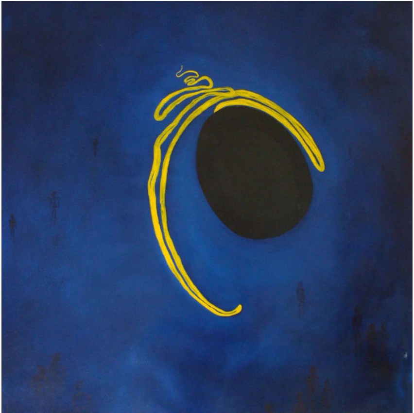
Laurence Wyllie, Sans titre , 2007, huile sur toile, 131x131cm.