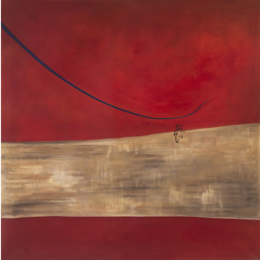
Laurence Wyllie, L'eau, l'enfant et l'électricité , 2007, huile sur toile, 131x131cm.