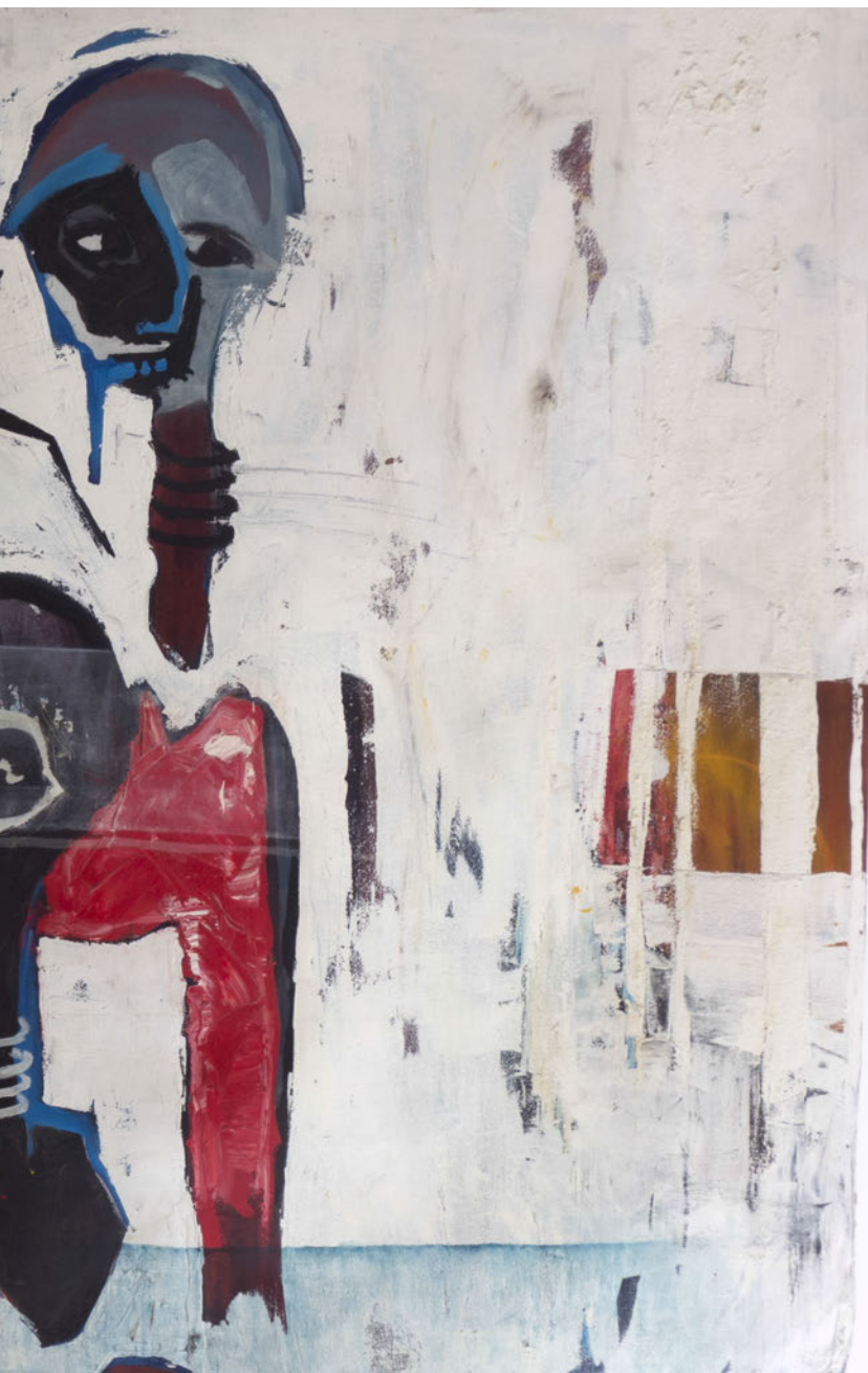
Laurence Wyllie, Triptique , 2008, huile sur toile, 131x131cm.