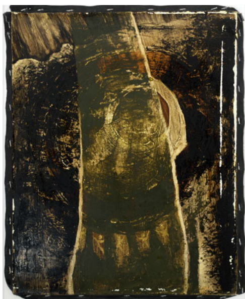
Laurence Wyllie, Cercle 3 , 2003, huile sur toile, 40x50cm.