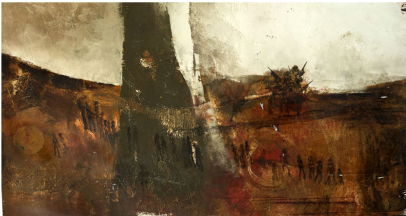
Laurence Wyllie, Sans titre , huile sur toile, 71x131cm.

C'est un véritable honneur pour nous d'accueillir une exposition rétrospective, d'une artiste aussi engagée que Laurence, utilisant l'art comme un outil de réflexion, de critique, de résistance, d'apprentissage et de partage.