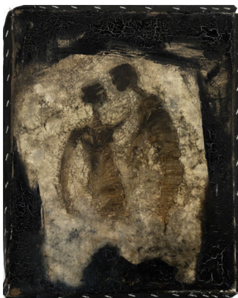
Laurence Wyllie, Cercle 2 , 2003, huile sur toile, 40x50cm.