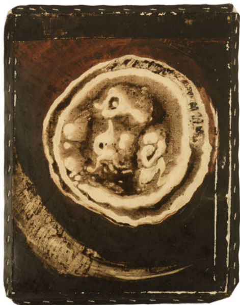
Laurence Wyllie, Cercle 1 , 2003, huile sur toile, 40x50cm.