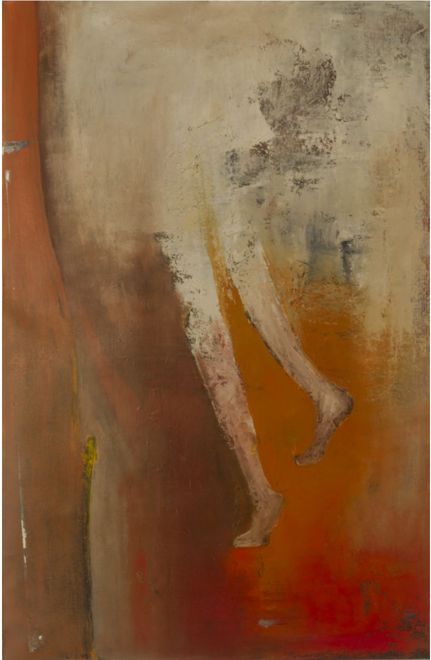
Laurence Wyllie, L'envol , 2008, huile sur toile, 60x91cm.