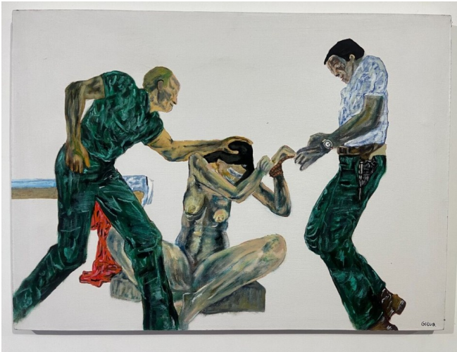
Leon Golub, 1981, Interrogation III, acrylique sur toile

Les œuvres de Banksy, Leon Golub et Nancy Spero illustrent l'utilisation de l'art à des fins d'activisme, de féminisme et de résistance, offrant des moyens de réflexion sur les défis contemporains.