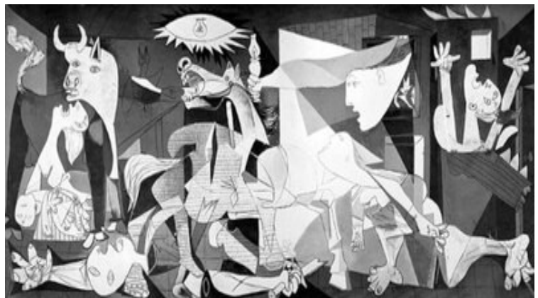
Picasso. Guernica 1937, one of his best-known works, perhaps the most powerful anti-

Artists challenge injustices, promote equality, and inspire action, leading to movements for civil rights, environmental concerns, and other social causes. The arts—all forms of expression—have played a significant role in shaping and influencing