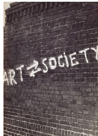
Archival Reflections: Art Into Society Posted on: 22 Feb 2016 www.archive.ica.art/whats-on/art-society-society-art

Sociological art, for example, is an artistic movement and approach to aesthetics that is a basis for attentive, caring, art. The history of sociological art can be traced through the independent practices of artists like Fred Forest, Hervé Fischer, and Jean-Paul Thenot, or the exhibition "Art Into Society, Society Into Art" at the Institute Of Contemporary Art, London, in 1974, an exhibition that drew on the notion of an 'active' process, moving away from an individualistic approach to a more participative, democratic art.