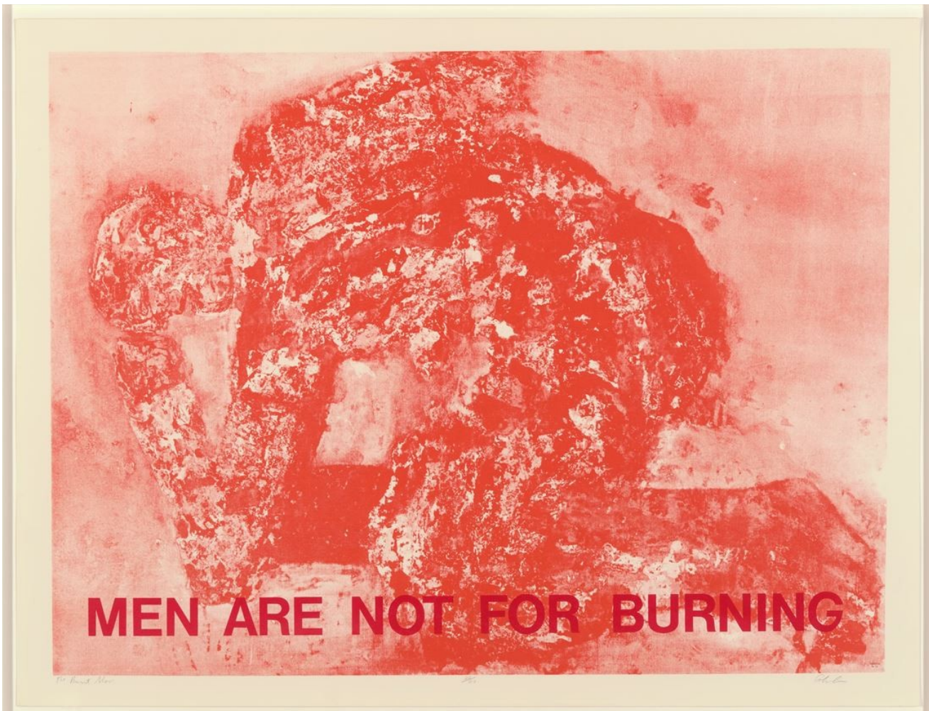
Leon Golub Burnt Man, 1969 Silkscreen 96.5 x 127 cm

Awareness of others and of the world is fundamentally needed if we are to endure the new ecosystems of nature and society.