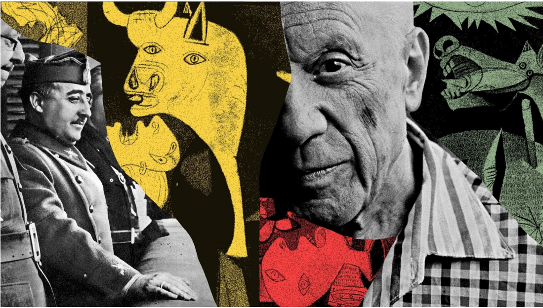
Picasso, Guernica, 1937, l'art contre la tyrannie,