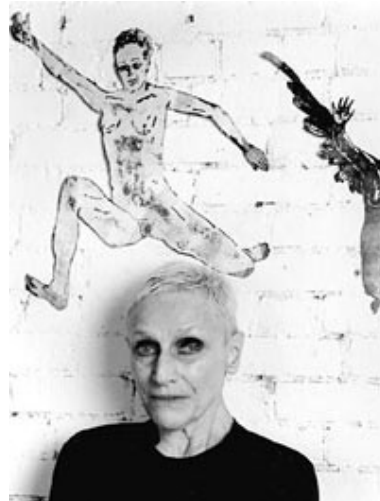
ever spiro "peinture féminine" 1926-2009 Nancy Spero

En conclusion, le concept de soin devient essentiel pour tisser un réseau de relations sociales positives et inclusives, soutenant à la fois soi-même et les autres. Malgré l'individualisme souvent présent dans les sociétés modernes, il est crucial de se rappeler que personne ne peut véritablement exister en dehors de ses relations avec autrui. Comme le souligne Nel Noddings, le soin est une vertu profondément enracinée dans la réceptivité, la relation et la réactivité, nécessitant une attention sincère envers autrui qui dépasse les simples obligations culturelles.