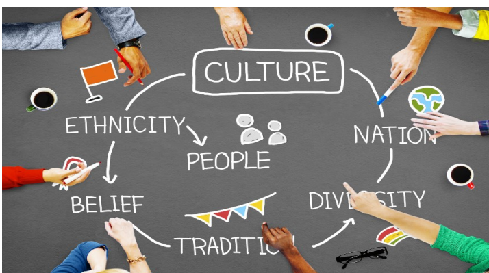
How can we appreciate different cultures? https://preissmurphy.com/how-can-we-appreciate-different-cultures-2

En conclusion, le concept de soin devient essentiel pour tisser un réseau de relations sociales positives et inclusives, soutenant à la fois soi-même et les autres. Malgré l'individualisme souvent présent dans les sociétés modernes, il est crucial de se rappeler que personne ne peut véritablement exister en dehors de ses relations avec autrui. Comme le souligne Nel Noddings, le soin est une vertu profondément enracinée dans la réceptivité, la relation et la réactivité, nécessitant une attention sincère envers autrui qui dépasse les simples obligations culturelles.