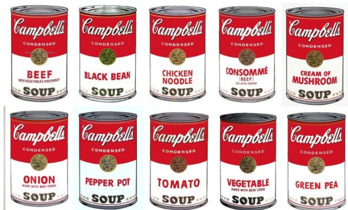
Andy Warhol, Campbell's Soup Cans, 1962 acrylique et émail sur toile, 32 panneaux, 50,8 x 40,6 cm chacun New York, MoMA

Les artistes critiquent cette obsession consumériste et nous mettent en garde contre les risques de l'évolution rapide et de la dépendance technologique. Keith Haring soulignait l'im-portance intemporelle du dessin, qui relie l'homme au monde à travers la magie.