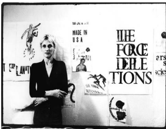
Nancy Spero 1974 New York, first cooperative gallery of female artists in the United States.

Banksy, Leon Golub, and Nancy Spiro are only a few examples of artists whose work has been used for purposes of activism, feminism, resistance, and resilience. Their works are fantastic tools for reflecting on current issues and raging about crucial events such as war, violence in the streets, the civil rights movement, and gender issues, among many others.