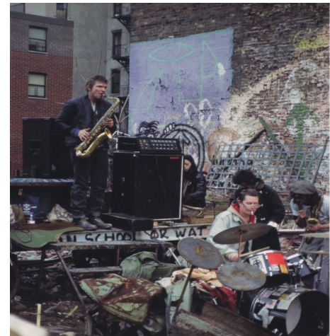
Zwicky and Gizmo @ Rivington School Sculpture Garden, 1986

A la fin des années 1960, New York est devenue l'épicentre du monde de l'art – un véritable carrefour pour des mouvements artistiques émergents attirant des créateurs venus des quatre coins du globe. Ces artistes ont transformé les rues délabrées et sales du centre-ville de Manhattan en une toile ouverte, couvrant les murs d'images puissantes et d'un langage engagé socialement. A travers des fresques colorées, des graffitis percutants et des sculptures réalisées à partir de matériaux récupérés, ils ont redonné vie à des espaces urbains oubliés, insufflant une nouvelle énergie à leur environnement. Leur travail allait au-delà de l'art, abordant des thèmes comme les sans-abris et les luttes des anciens combattants, tout en redonnant espoir à une ville confrontée à la pauvreté, à la toxicomanie et aux inégalités.