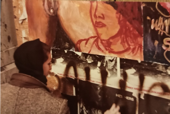
first demonstration of The Gorilla Girls, NYC, at 719 Broadway, NYU Tisch School of the Arts, 1984-5

The women artists of the East Village spearheaded groundbreaking initiatives, including the first Guerrilla Girls event, held at 719 Broadway. These artists tirelessly addressed issues of justice, equality, and liberty, shaping art as a medium of social change.