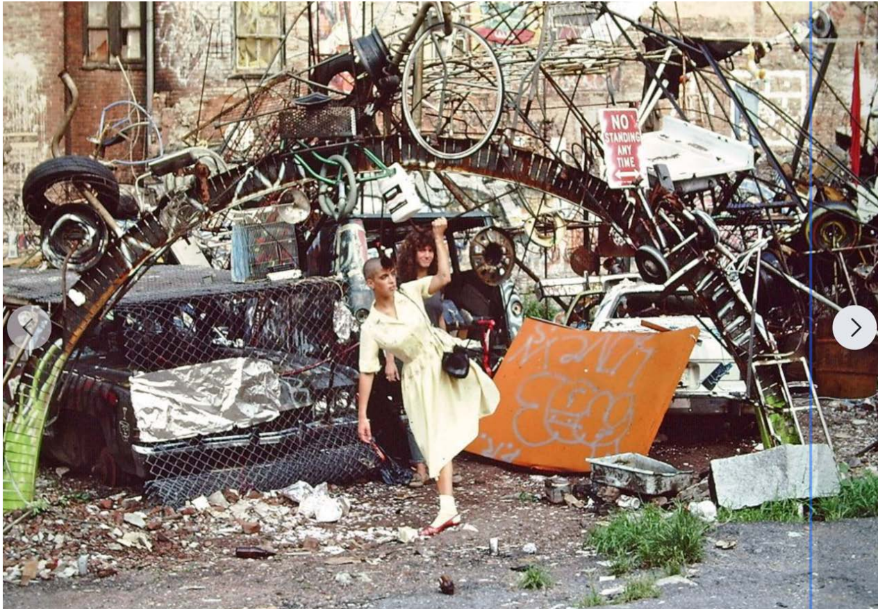
Rivington School artists 1985-1987

A la fin des années 1960, New York est devenue l'épicentre du monde de l'art – un véritable carrefour pour des mouvements artistiques émergents attirant des créateurs venus des quatre coins du globe. Ces artistes ont transformé les rues délabrées et sales du centre-ville de Manhattan en une toile ouverte, couvrant les murs d'images puissantes et d'un langage engagé socialement. A travers des fresques colorées, des graffitis percutants et des sculptures réalisées à partir de matériaux récupérés, ils ont redonné vie à des espaces urbains oubliés, insufflant une nouvelle énergie à leur environnement. Leur travail allait au-delà de l'art, abordant des thèmes comme les sans-abris et les luttes des anciens combattants, tout en redonnant espoir à une ville confrontée à la pauvreté, à la toxicomanie et aux inégalités.