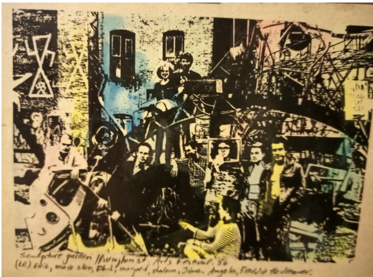
© anonym Sculpture Garden, Rivington and Stanton Street, NYC, 1985

Vibrant, empty squats opened across the East Village and the Bowery, while street corners became meeting places for artists to build alternative spaces for community interaction.