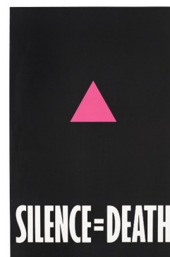
Art of the AIDS Crisis, Gran Fury advertisement "Silence=Death."

Les années 1980 et 1990 furent des périodes de grandes souffrances à New York. Comme l'a écrit l'artiste américain David Wojnarowicz, mort du SIDA en 1992 : « Nous sommes en colère et nous nous plaignons parce que nous devons le faire, mais ce que nous souhaitons, c'est de retourner vers la beauté. Si nous laissons tomber cela, nous n'avons plus d'endroit où aller. » Les guerres du Vietnam, du Cambodge et d'Afghanistan, la Guerre froide et le virus du SIDA ont non seulement dévasté les communautés queer, mais aussi les populations pauvres, immigrées et issues des toutes minorités, tandis que les politiciens restaient largement silencieux sur les questions de justice et d'égalité. Dans ce contexte, les artistes ont commencé à utiliser leur travail comme un puissant appel à l'action.