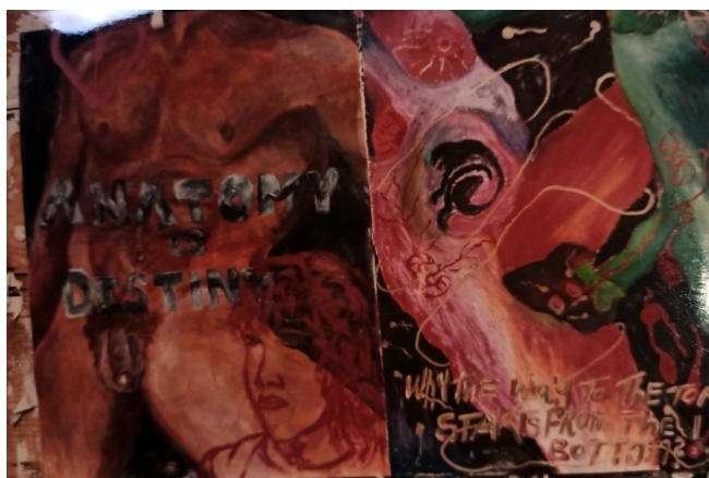
première manifestation des Guerrilla Girls, NYC : Why the way to top starts from the bottom, | Pourquoi le chemin vers le sommet commence par la bas.

Les femmes artistes de l'East Village ont été à l'avant-garde d'initiatives novatrices, y compris le premier événement des Guerrilla Girls, organisé au 719 Broadway. Ces artistes ont inlassablement abordé les questions de justice, d'égalité et de liberté, façonnant l'art comme un moyen de changement social.